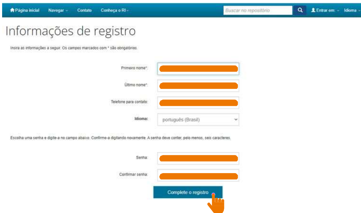
Figura 06 – Registro de dados pessoais.

Registre seus dados e crie uma senha para acesso, em seguida, clique em “Complete o registro”, conforme as figuras 06 e 07.