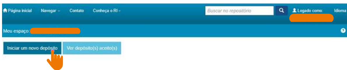
Figura 10 – Primeira etapa para realização de depósito.

Após o recebimento do e-mail de liberação, entre na página do RI/UFBA, insira o login e a senha cadastrada na parte superior, no lado direito da página, e clique em “Meu espaço” e, posteriormente, em “Iniciar um novo depósito”, conforme a figura 10.