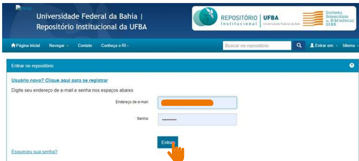
Figura 09 – Acesso com login e senha.

Preencha os campos com o e-mail registrado e a senha cadastrada e clique em “Entrar”, conforme a figura 09.