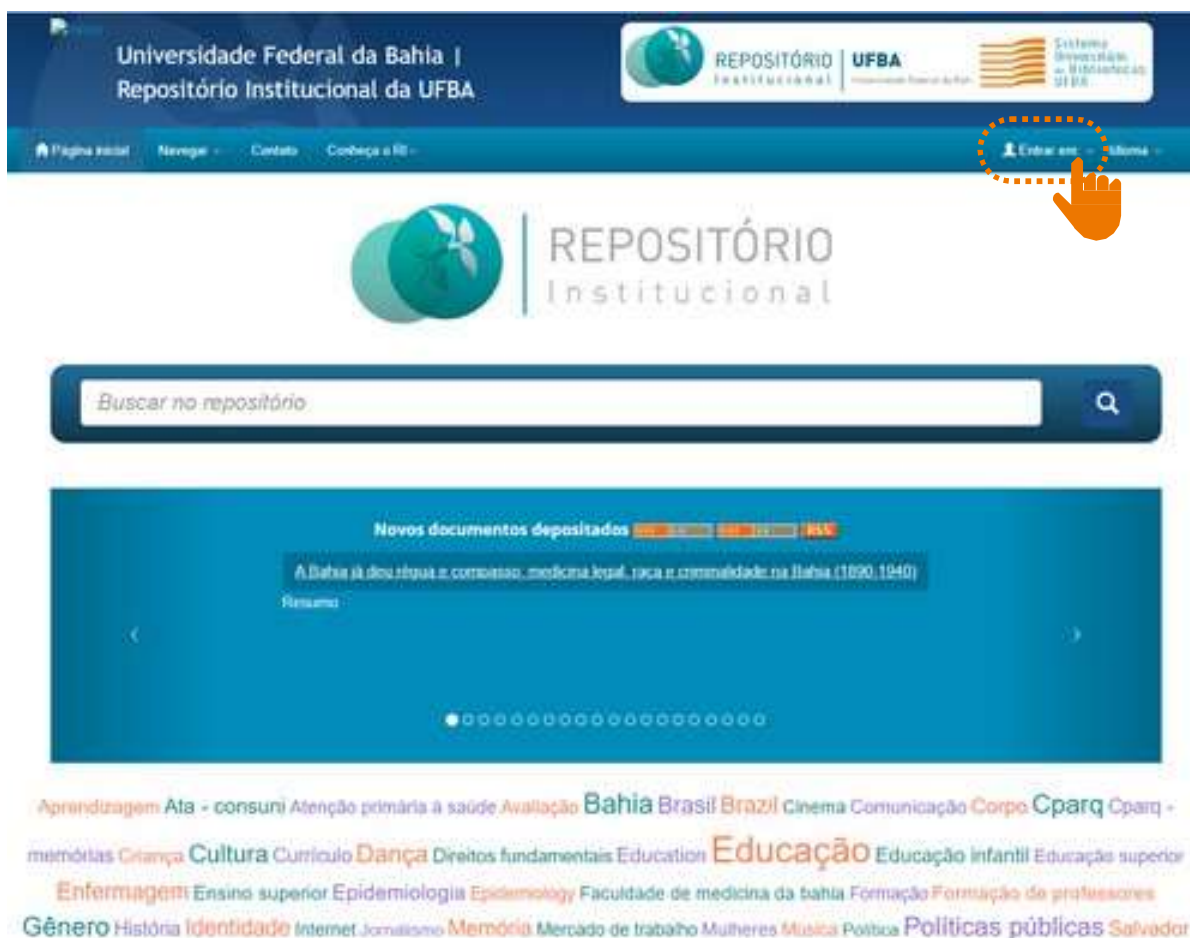
Figura 01 – Acesso ao “Meu Espaço”.

Clique em “Entrar em:”, em seguida “Meu espaço” na página inicial da parte superior do lado direito da página, conforme figura 01.