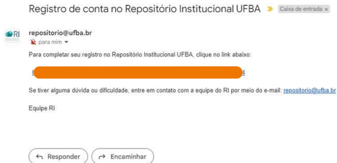
Figura 05 – Mensagem de acesso à URL recebida por e-mail.

Acesse o e-mail e clique na URL recebida (figura 05).