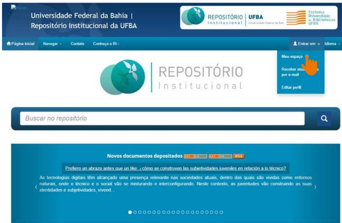
Figura 08 – Acesso ao meu espaço.