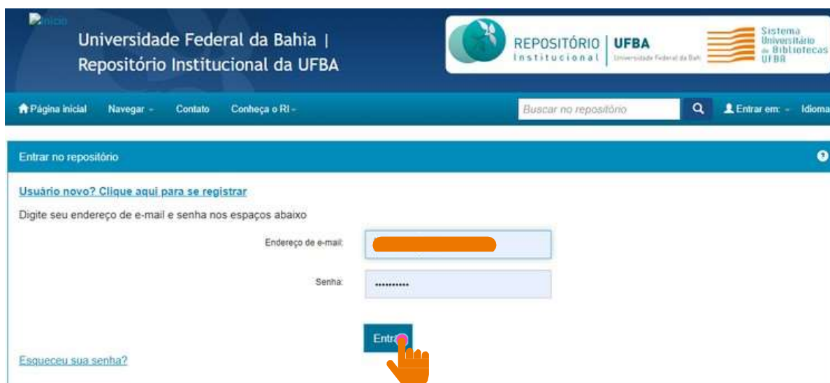
Figura 02 – Inserção do endereço de e-mail e senha.

Realize o login com seu endereço de e-mail e senha, conforme figura 02.