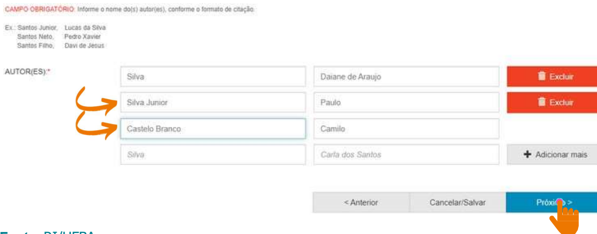
Figura 09 – Cadastro de autor com sobrenome composto e com indicação de parentesco.