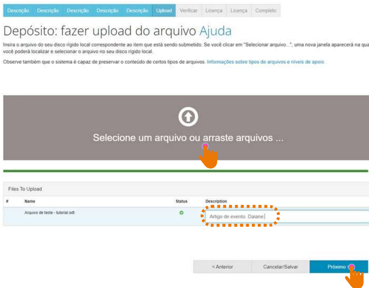
Figura 17 - Upload do trabalho e descrição do arquivo.

Clique em "Selecionar arquivo ou arraste arquivos..." para fazer o upload do documento (figura 17).