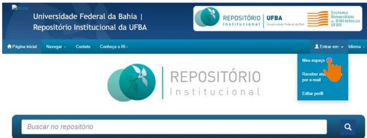
Figura 01 – Acesso ao "Meu Espaço".